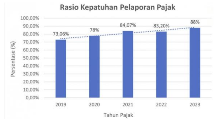
Grafik 1. Rasio Kepatuhan Pelaporan Pajak Tahun 2019-2023

Berdasarkan data yang diperoleh sepanjang tahun 2023 Direktorat Jenderal Pajak (DJP) melaporkan telah mengirimkan 387.089 Surat Permintaan Penjelasan atas Data dan/atau Keterangan (SP2DK) kepada 279.102 Wajib Pajak. Dari jumlah itu, nilai SP2DK tercatat sebesar Rp21,18 triliun. Sementara itu, Laporan Hasil Penjelasan atas Data dan/atau Keterangan (LHP2DK) yang terbit tahun 2023 tercatat sebesar Rp24,44 triliun. Realisasi kepatuhan wajib pajak dalam menyampaikan SPT sepanjang 2022 mencapai 83,2%. Meskipun terjadi penurunan dari pencapaian tahun sebelumnya, angka tersebut masih melampaui target yang ditetapkan sebesar 80%. Terakhir, dalam Konferensi Pers 2023 Kinerja dan realisasi APBN 2024, data terkini menunjukkan bahwa tingkat kepatuhan pelaporan pajak pada tahun 2023 mencapai 88%. (kompasiana.com)