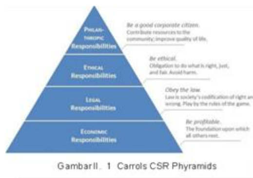
Gambar II. 1 Carrols CSR Phyrramids

Menurut Carrol (1991) mendefinisika CSR dengan responsibility approach yang terdiri dari economic responsibility, legal responsibility, ethical responsibility, dan philanthropic responsibility. Carrol 's menggambarkan CSR dalam 4 dimensi atau lebih dikenal dengan CSR Phyrramids (Nurlaela:12:2018).