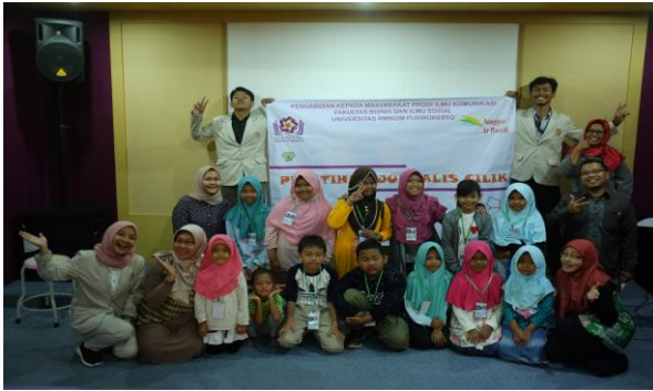
Gambar 2. Fasilitator dan sebagian peserta pelatihan