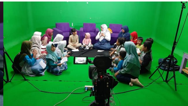
Gambar 5. Fasilitator sedang memberikan penjelasan pada peserta pelatihan dibantu mahasiswa