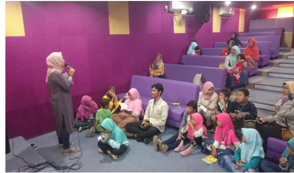
Gambar 3. Fasilitator sedang memberikan penjelasan pada peserta pelatihan dibantu mahasiswa