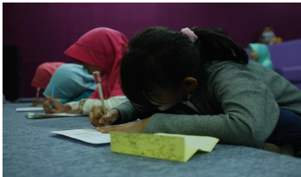
Gambar 4. Peserta sedang menuangkan ide ke dalam bentuk tulisan/berita