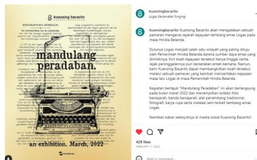
Gambar 1.

Instagram @kuansingbacarito merupakan media digital yang menyajikan informasi sejarah dan budaya Kabupaten Kuantan Singingi. Berbagai bentuk konten dilakukan untuk menyampaikan informasi tentang cerita kepada masyarakat, tujuannya agar masyarakat mengetahui bahwa sejarah Mandulang sudah ada sejak lama. Menurut Tylor (dalam Laode:2014) budaya adalah kumpulan pengetahuan, kepercayaan, maupun seni, adat istiadat, keterampilan. Dalam hal tentunya mandulang merupakan penyumbang utama kerusakan lingkungan dan pencemaran lingkungan, meskipun ada aturan yang melarangnya karena legal. Namun hal tersebut bukan karena kurangnya minat masyarakat terhadap mandulang melainkan karena antusias mereka yang menjadikan mandulang sebagai profesi masyarakat sekitar.