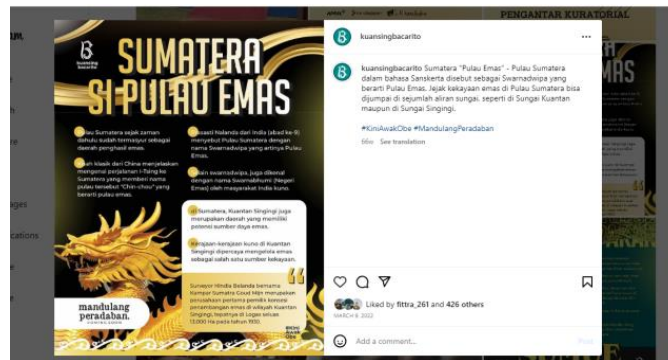
Gambar 2

Dilihat dari bentuk postingan yang dilakukan oleh @kuansingbacarito dalam melakukan publikasi informasi, dimana postingan yang dibuat tersebut sebagai bentuk memberikan informasi kepada masyarakat terkait mandulang, serta memberikan efek terhadap postingan dengan warna yang sedikit memudar. Pesan yang diberikan pada postingan tersebut ialah tentang benda sejarah, koleksi foto, hal tersebut tentunya menjadi informasi bagi masyarakat di instagram bahwa kuantan singingi memiliki sejarah terhadap mandulang, yang memang ada dan ditandai dengan adanya peninggalan yang di temukan. Instagram @kuansingbacarito memberikan berbagai wawasan terhadap informasi terhadap sejarah mandulang dari berbagai aspek misalnya kegiatan masyarakat, serta kebiasaan – kebiasaan masyarakat.