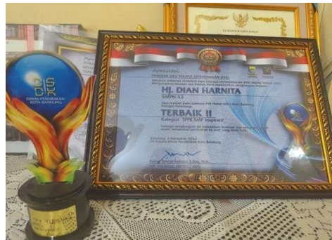
Gambar 6. Penghargaan TPPK SMP Inspiratif II oleh Kepala Dinas Pendidikan Kota Bandung

Keberhasilan program Zero Bullying tidak hanya ditentukan oleh kesamaan strategi, melainkan oleh kapasitas adaptif tiap aktor dan sinergi berdasarkan potensi lokal. Komitmen yang terbangun dari masing-masing pihak menjadi bukti bahwa motivasi bersama dalam kolaborasi ini bersifat dinamis dan terus berkembang. Meskipun demikian, tantangan tetap ada, seperti belum optimalnya kerja sama dengan media massa dalam menyebarkan informasi secara luas. Namun demikian, keseluruhan proses menunjukkan bahwa motivasi bersama tidak semata-mata bersumber dari struktur formal, melainkan lahir dari relasi kepercayaan, kejelasan peran, dan pembentukan komitmen yang berkesinambungan di antara para pemangku kepentingan.