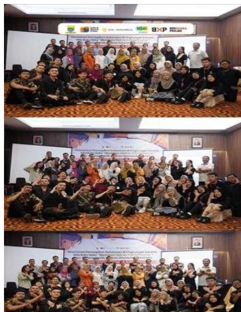
Gambar 4. Kegiatan Diseminasi Pencegahan Kekerasan Rilis Buku Saku "Bersuara Tindak Perundungan"