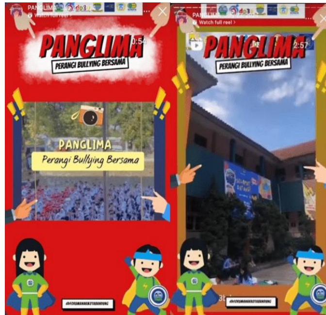
Gambar 3. Sosialisasi Panglima SMPN 43 dan SMPN 53 Kota Bandung Sumber: Instagram Resmi Fokab Kota Bandung, 2024