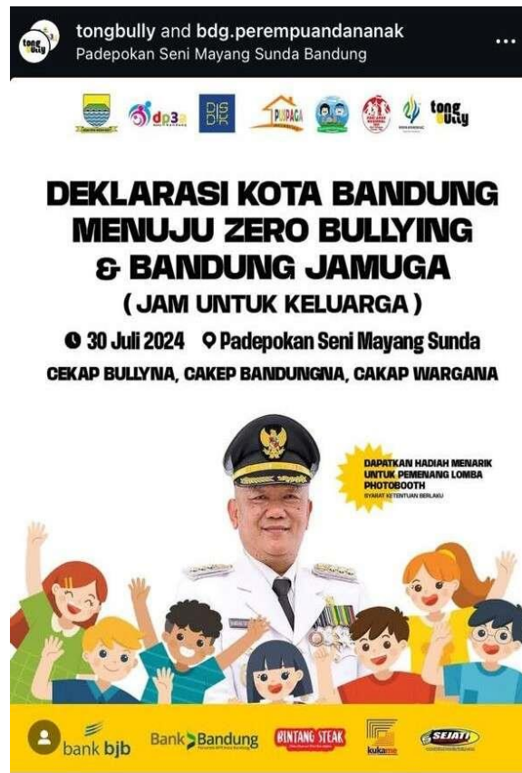
Gambar 2. Puncak komitmen pencegahan perundungan di SMPN Kota Bandung

mempertegas komitmen kolektif, dengan melibatkan OPD, komunitas, serta sektor swasta, dan pihak sekolah.